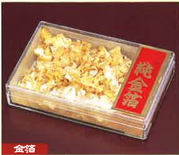
●T18-01 金箔ケース入(大) 88×58×20mm/約0.12g入 ¥1,500