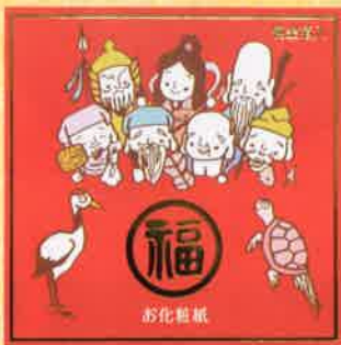
●T19-24 七福神 30枚綴 90×90mm ¥300