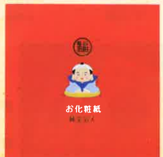
●T19-26 福助 30枚綴 90×90mm ¥300