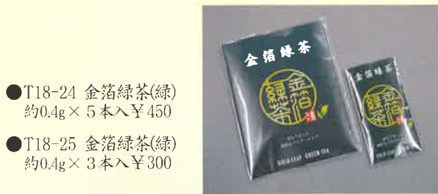
●T18-24 金箔緑茶(緑) 約0.4g×5本入 ¥450