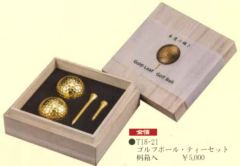
●T18-21 ゴルフボール・ティーセット 桐箱入 ¥5,000