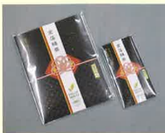
●T18-26 金箔緑茶(水引) 約0.4g×5本入 ¥450