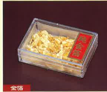
●T18-03 金箔ケース入(小) 68×47×20mm/約0.04g入 ¥600