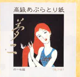
●T19-12 長き髪 40枚綴 90×90mm ¥350