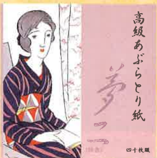
●T19-10 読書 40枚綴 90×90mm ¥350