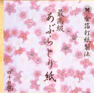
●T19-04 桜 40枚綴 90×90mm ¥300