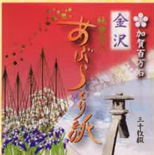
●T19-20 加賀百万石 30枚綴 90×90mm ¥300