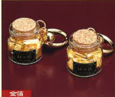
●T18-04 金箔ビン入(大) φ29×28mm ¥600