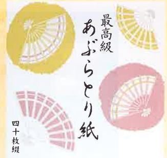
●T19-06 扇 40枚綴 90×90mm ¥300