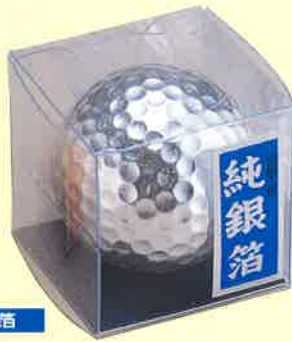
●T18-11 ゴルフボール(銀) φ40mm ¥1,300