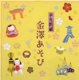
●T19-21 金沢あそび 30枚綴 90×90mm ¥300