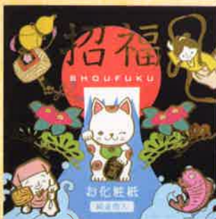
●T19-25 招福(黒) 30枚綴 90×90mm ¥300