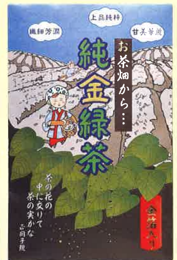
●T18-16 金箔緑茶 正岡子規 約0.4g×6本入 ¥500