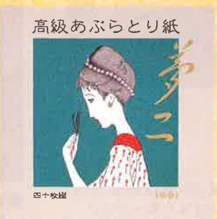
●T19-11 萌春 40枚綴 90×90mm ¥350