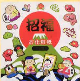
●T19-23 招福(白) 30枚綴 90×90mm ¥300