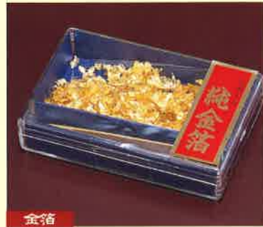
●T18-02 金箔ケース入(大)竹箸付 88×58×20mm/約0.08g入 ¥1,500