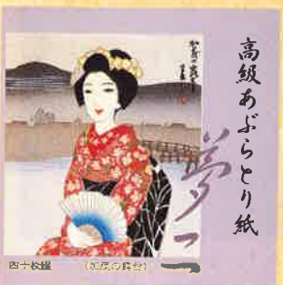
●T19-09 加茂の露台 40枚綴 90×90mm ¥350

独自の抒情にあふれるその作風は、明治末期から昭和初期にかけて一世を風靡しました。ひとつの時代を創ったその美は、大正ロマンそのものです。