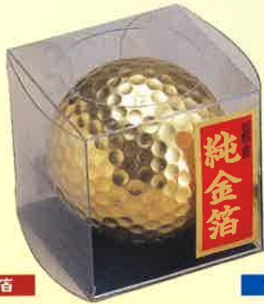
●T18-10 ゴルフボール(金) φ40mm ¥1,500