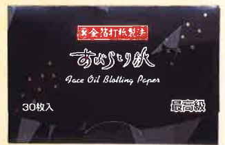
●T19-05 パッケージタイプ 30枚綴 60×90mm ¥250