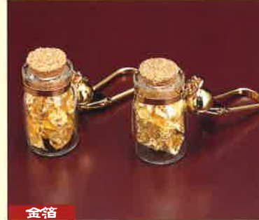
●T18-05 金箔ビン入(小) φ20×34mm ¥500