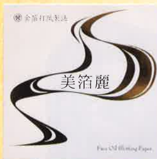
●T19-22 美箔麗 30枚綴 90×90mm ¥300