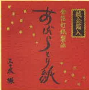
●T19-01 散箔 30枚綴 90×90mm ¥300

このあぶらとり紙は、箔打ち職人が金箔打ちの技術と勘によって、金箔銀箔などを製造する箔打ち機械で、あぶらとり紙の原紙を約3万回という驚くべき回数で丹念に打ち叩いて仕上げたものです。この金箔打紙製法によるあぶらとり紙は、原紙の状態より紙の繊維がより一層叩き潰されて肌ざわりはなめらかで吸脂力に優れ、独特の風合いのあるあぶらとり紙に仕上がっております。