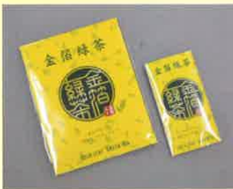
●T18-22 金箔緑茶(黄) 約0.4g×5本入 ¥450