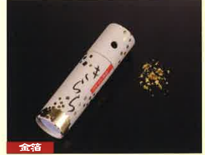
●T18-20 金箔ふりかけきらら φ25×97mm ¥1,000