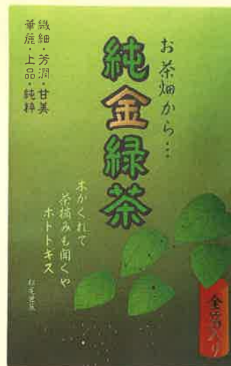
●T18-15 金箔緑茶 松尾芭蕉 約0.4g×6本入 ¥500